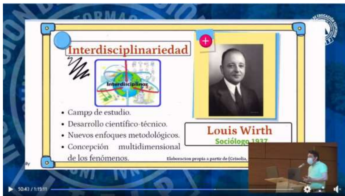
XII ENCUENTRO DE SEMILLEROS DE INVESTIGACIÓN - ITFIP 2022