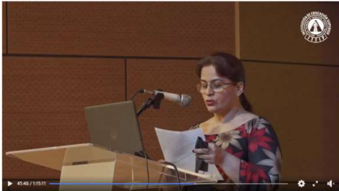
XII ENCUENTRO DE SEMILLEROS DE INVESTIGACIÓN - ITFIP 2022